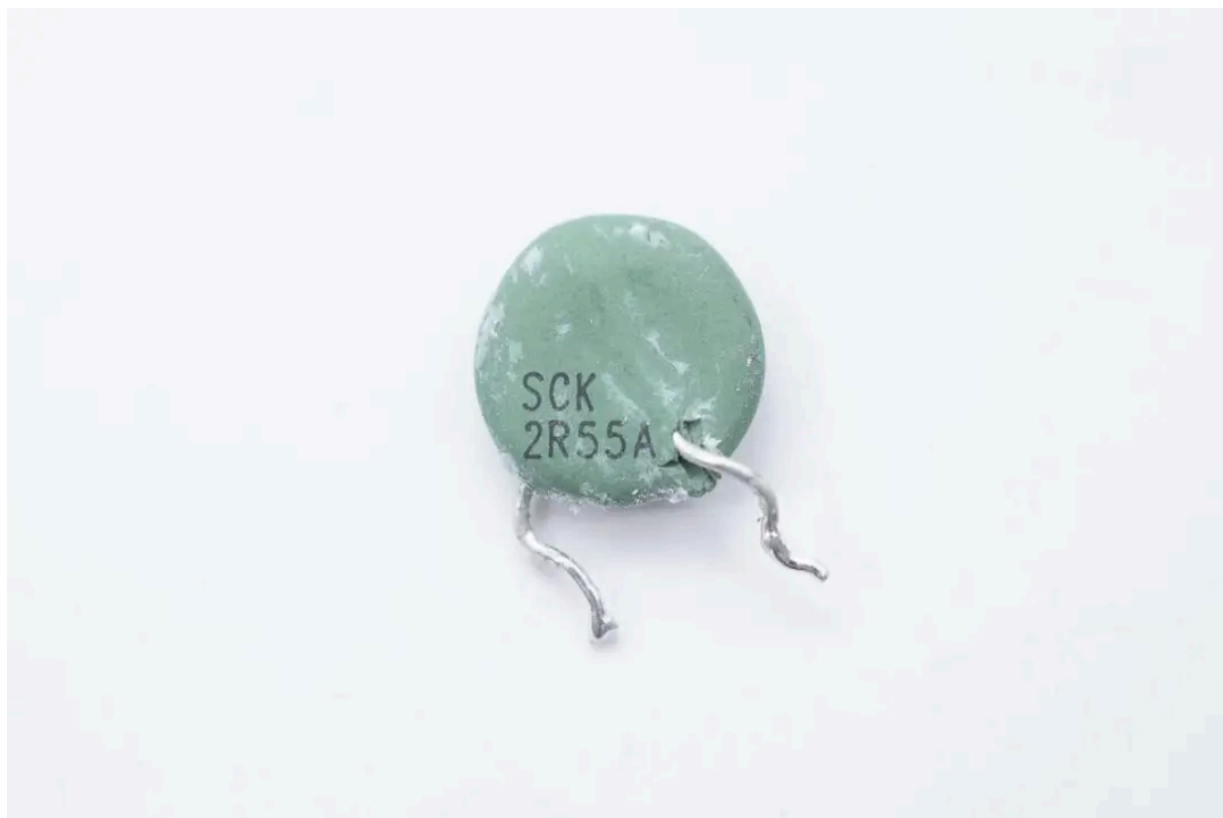
SCK2R55A NTC热敏电阻用于抑制上电的浪涌电流。